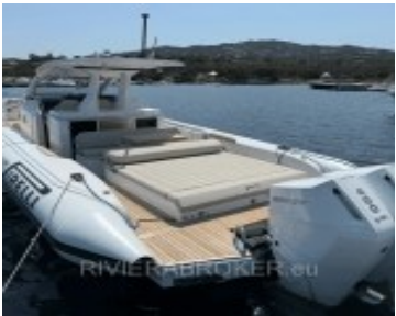
PIRELLI 42 EFB